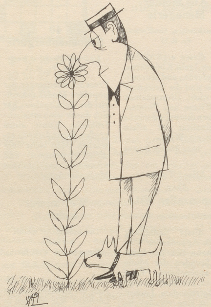
Jedem das Seine