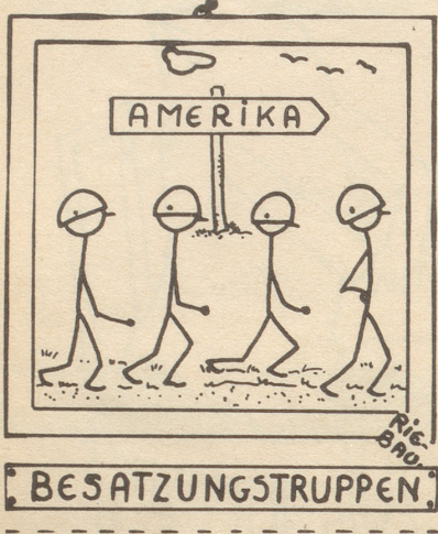
« Abzieh-Bild »