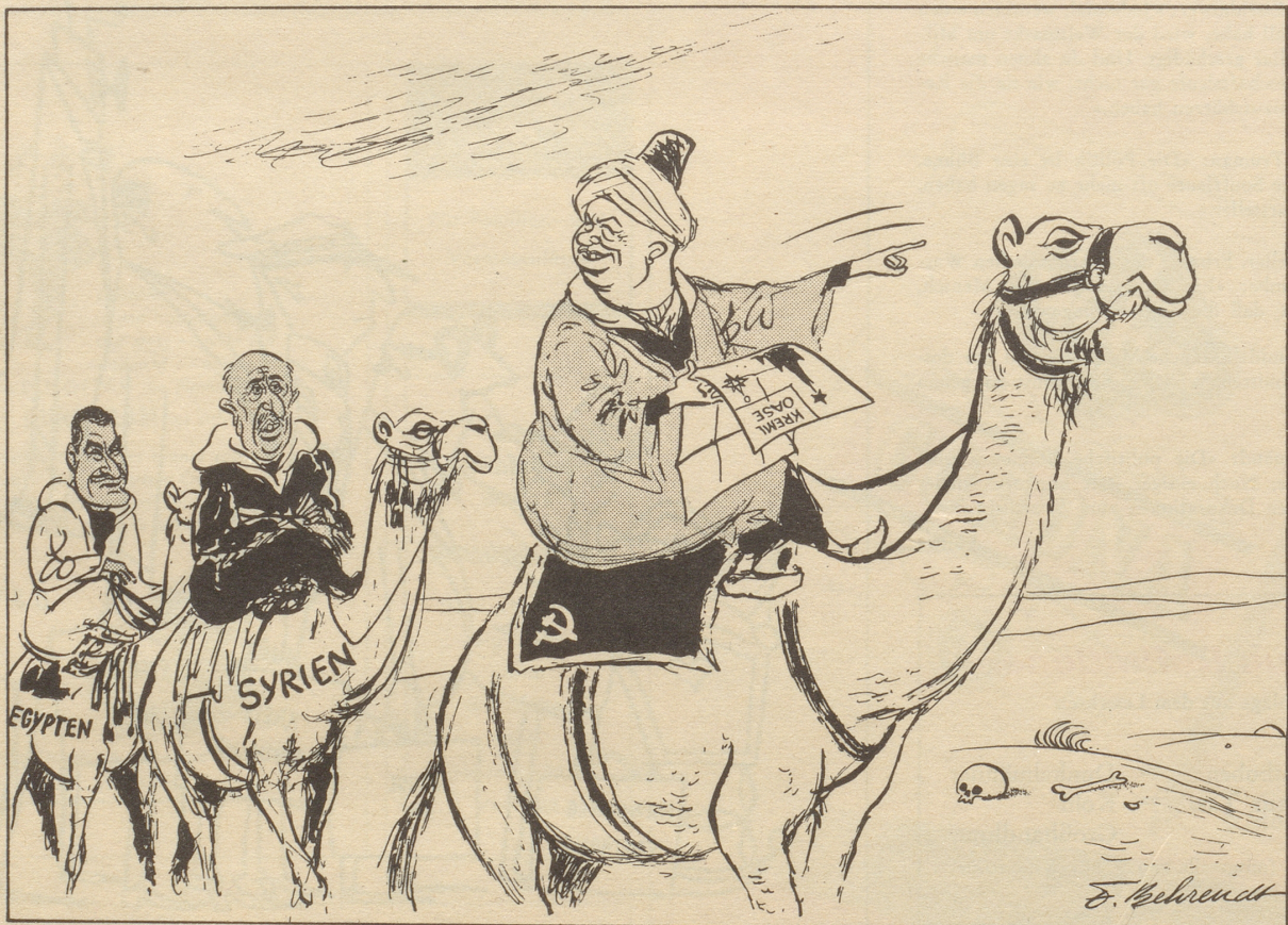
In die Wüste