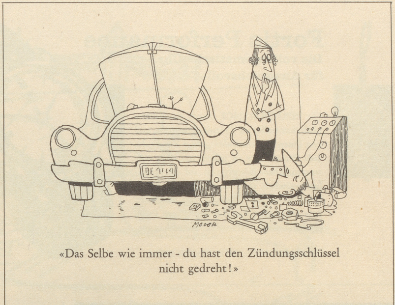
«Das Selbe wie immer - du hast den Zündungsschlüssel nicht gedreht!»

«Abah», grinst der Lausub, «dia blödi Gans isch vo ihrna Stöcklichueh abakeit.» Igel