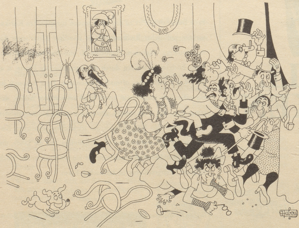
Der Gastgeber hat air-fresh vergessen!

«EUMIG» Kunz + Bachofner, Grünliststraße 44, Zürich 2 / Telephon (051) 25 15 27