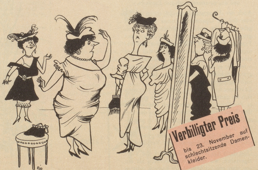
Die Folgen eines Inserates

Flüchtige Leser, die den Nebi durchblättern, die Bildli angucken, die Witze lesen und von den längeren Artikeln nur Titel und Unterschrift zur Kenntnis nehmen, werden jetzt sagen: «Aha, da sieht man's wieder! Für eine dumme Geschichte, in zwei Stunden niedergeschrieben, bekommt sie vierzig Franken, das macht bei vierzig Stunden in der Woche achthundert Franken. Da kann sie sich leicht einen neuen Studebaker oder Cadillac kaufen! Und unsereins, der wirklich krampft, fährt immer noch den alten Fiat!» - Nun, lieber Leser, so du dich bis daher durchgelesen hast, laß dir erklären, daß deine Vermutungen nicht ganz stimmen, nicht in bezug auf das Honorar und schon gar nicht bezüglich des neuen Wagens. Es ist keiner von den bekannten chromblitzenden, kilometerfressenden, neiderweckenden Marken: es ist ein kleines, zweirädriges, strohgeflechtes Marktwägeli, Mittelding zwischen einem Tragkorb und einem Karren, dazu bestimmt, der Hausfrau das Schleppen zu ersparen und an Markttagen Händöpfel und Kabis, Salat und Radiesli, Suppenhuhn und Blumentopf in seinem Innern aufzunehmen und von der Besitzerin durch das dichteste Gewühl ge-