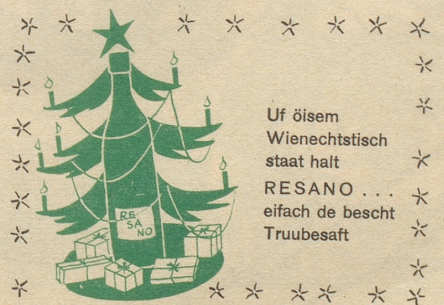
Bezugsquellennachweis durch: Brauerei Uster

Feuer breitet sich nicht aus, hast Du MINIMAX im Haus!