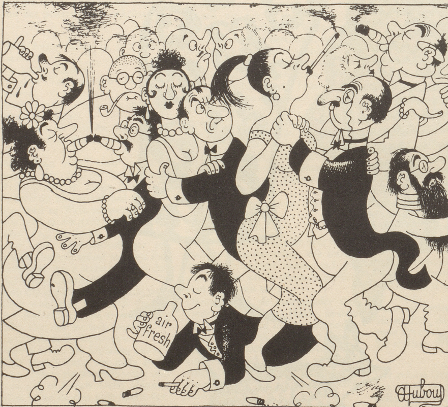
Glücklich ist wer air-fresh kennt!