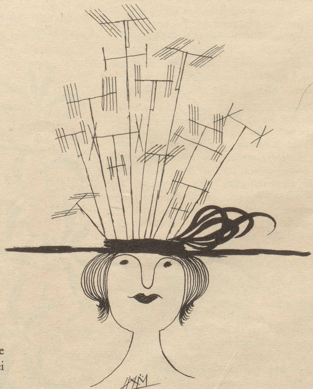
Der Hutmode jüngster Schrei