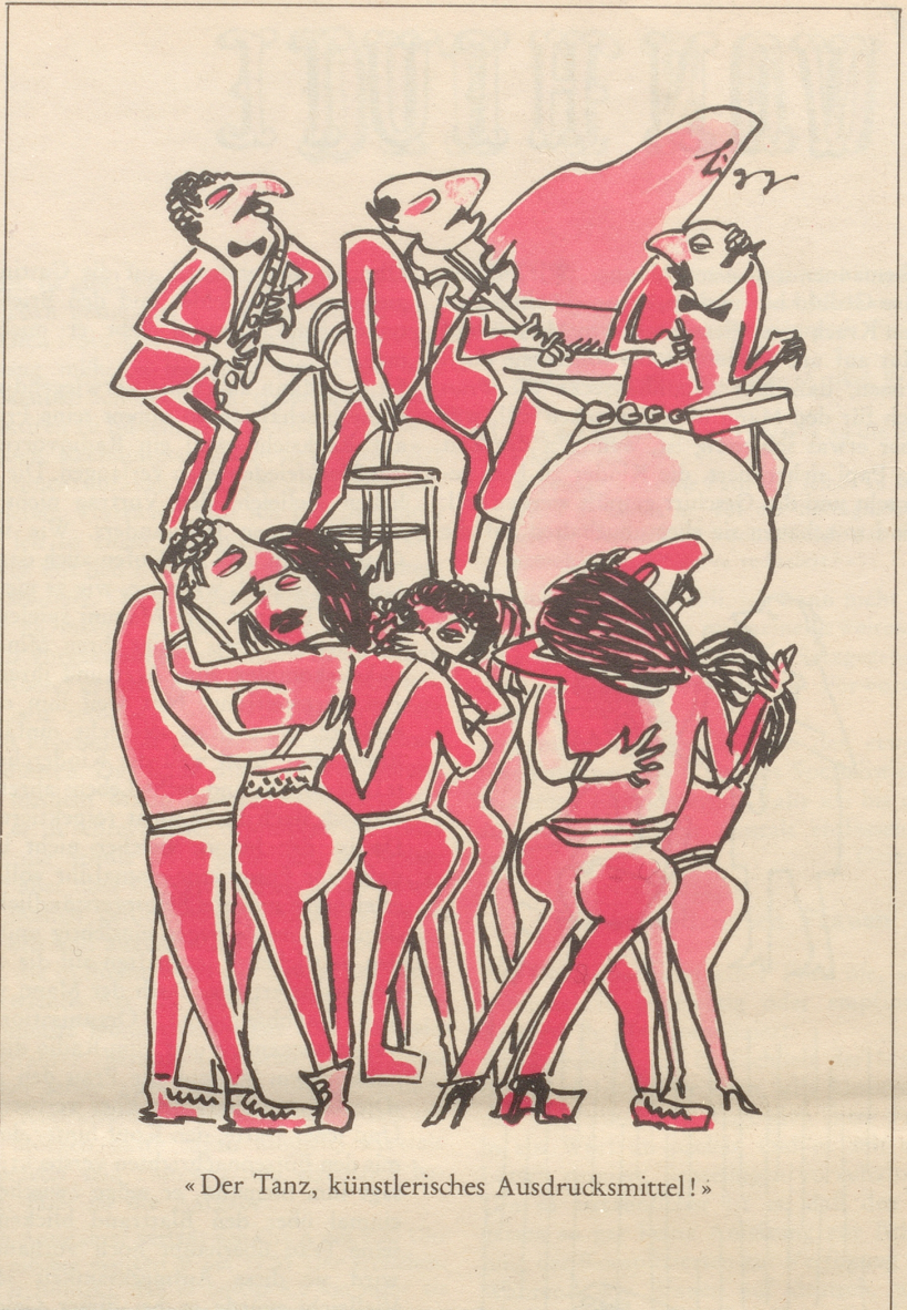
«Der Tanz, künstlerisches Ausdrucksmittel!»