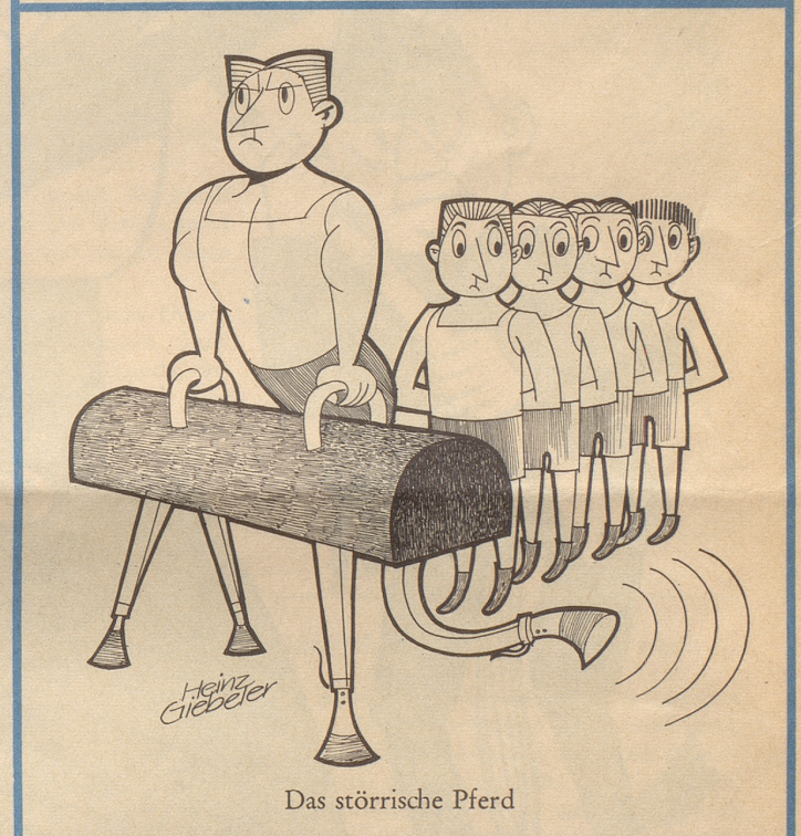
Das störrische Pferd