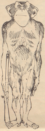
Warum soll es unserns nicht auch probieren?