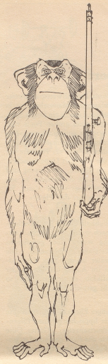
Die fehlende Hosennaht bietet einige Schwierigkeit.