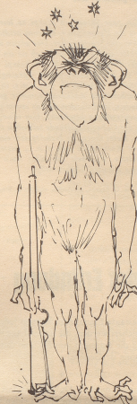
Bwana nkoga Sälachi!! (Schimpansisch. Nicht übersetzbar.)