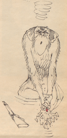
EMD und Miggel geben den Gewehrgriff auf. Beide mit etwelchen Schmerzen ...