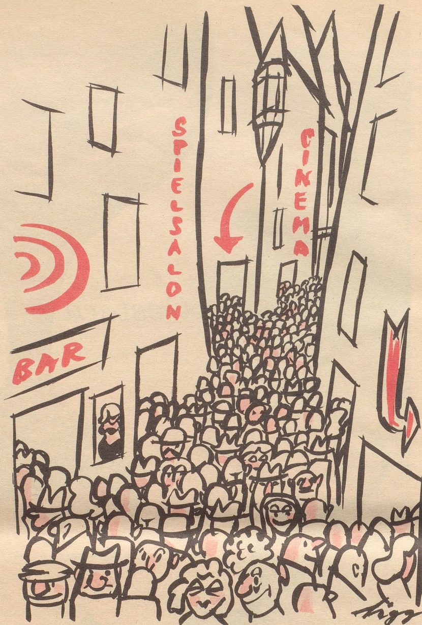
Das Vergnügen am Samstagabend

«Ein prächtiges, saftiges Stück», rühmte der Meister. «Es ist zwar etwas mehr, aber das mag's vertragen – oder etwa nicht?» meinte er gemütlich.