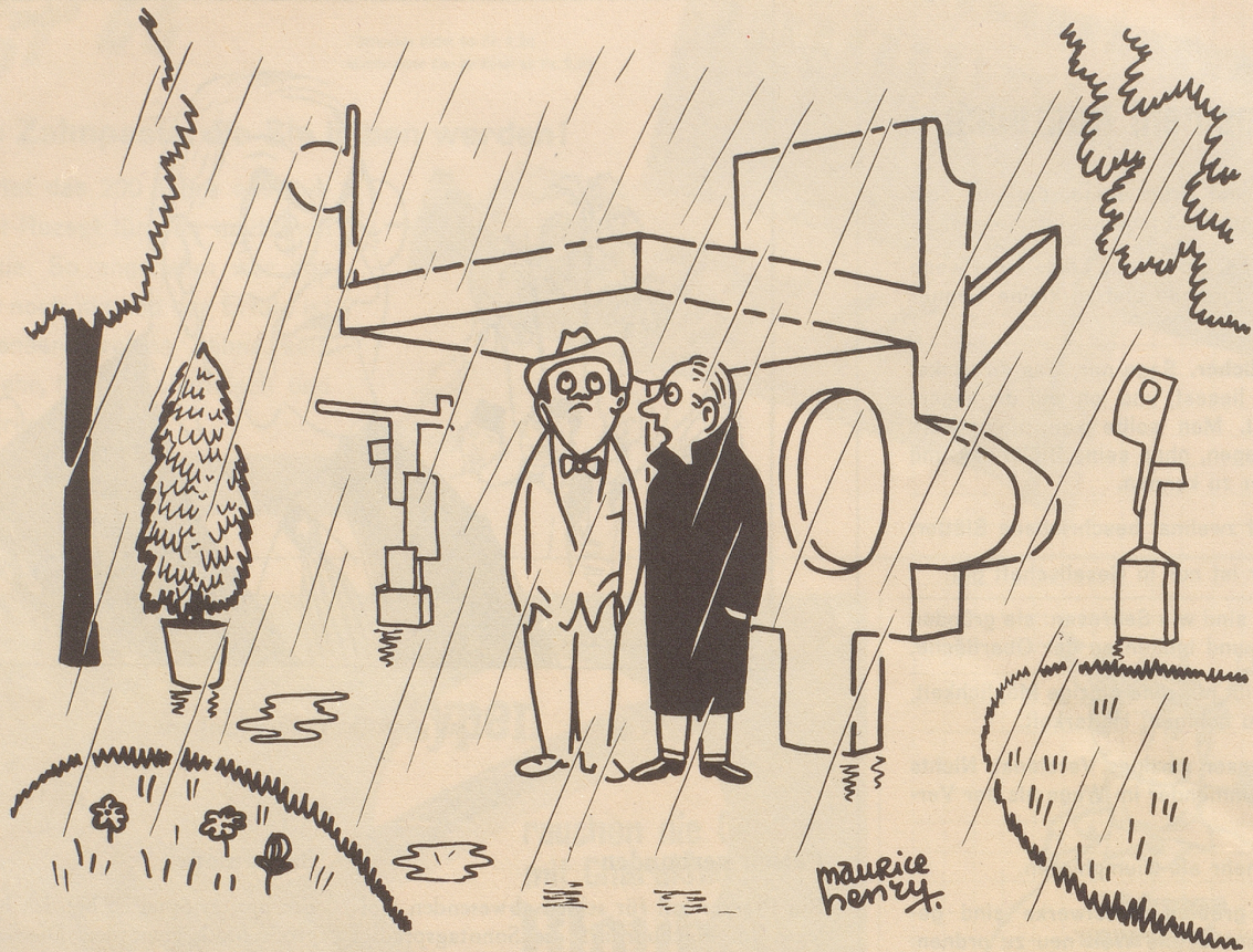
«Gar nicht so schlecht, die moderne Bildhauerei!»