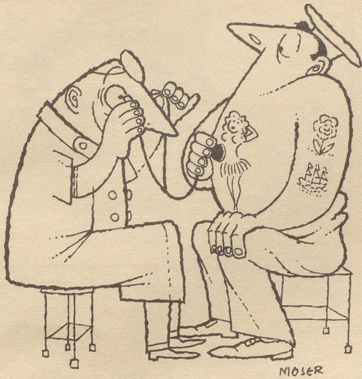
Lula aus Hawaii