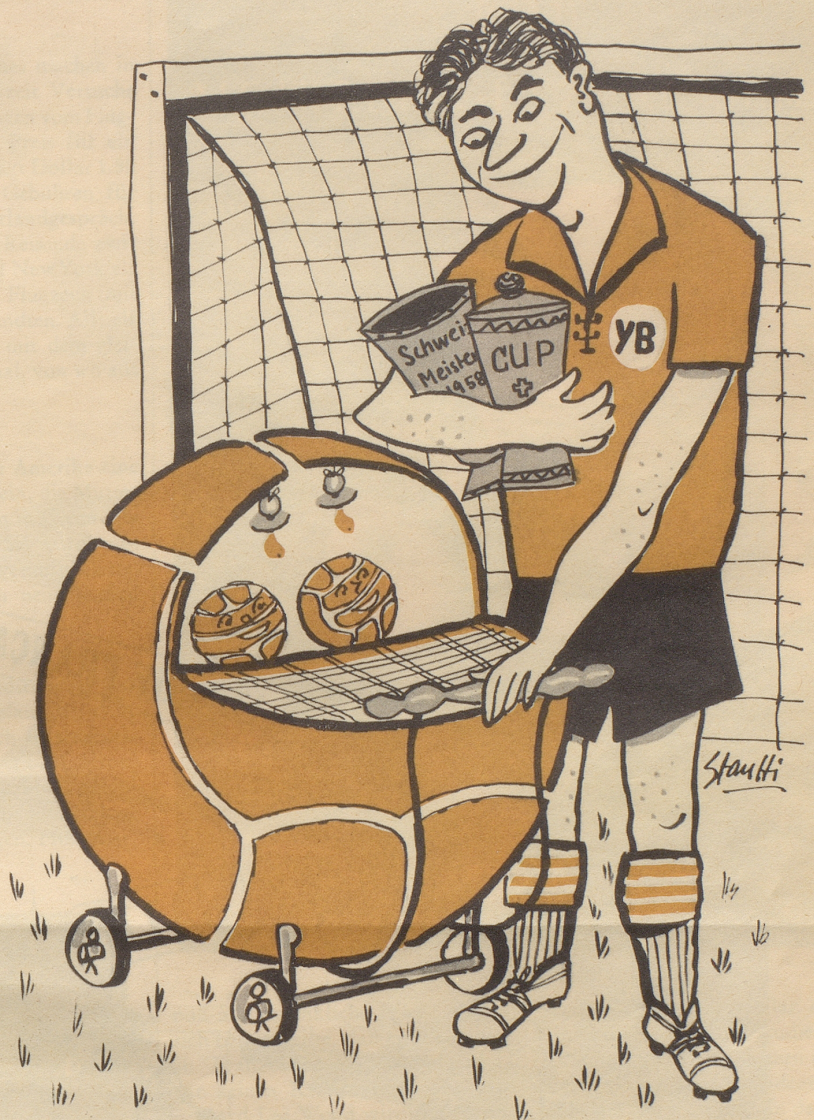
Die Young Boys wurden Schweizer Fußballmeister und Cup-Sieger 1958