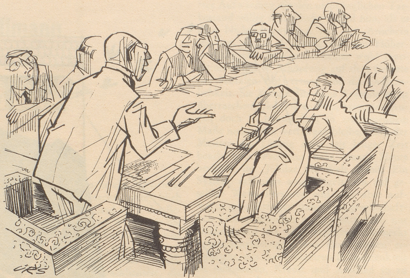
«In Sachen Sputnik sind wir überflügelt. Richten wir unser Augenmerk auf die Konstruktion des Anti-Sputnik!»

Die Zeitungskommentare sprechen von verworrener Lage im mittleren Osten. Gewiß, es ist ein Salat, der mit Erdöl angemacht ist. Möge es kein russischer Salat werden. Röbi