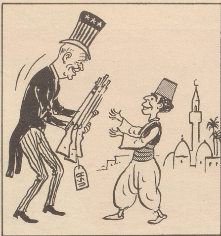
... ist eine Kunst ...