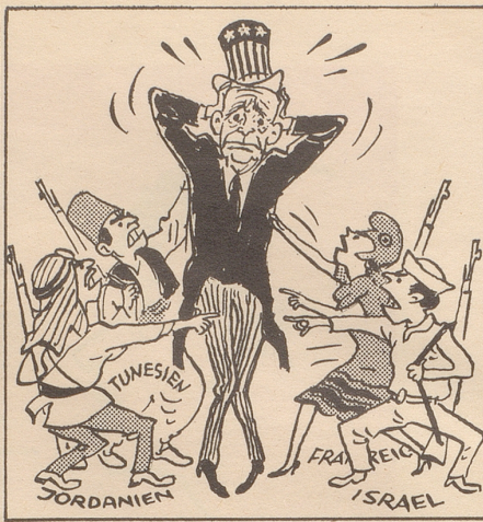
... die niemand kann!