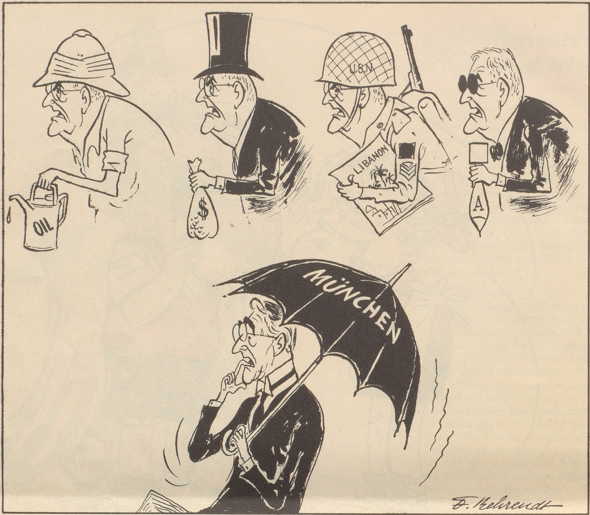
20 Jahre nach «München»

Man kann Dulles manches vorwerfen — aber nicht, daß er Chamberlain ähnelt!