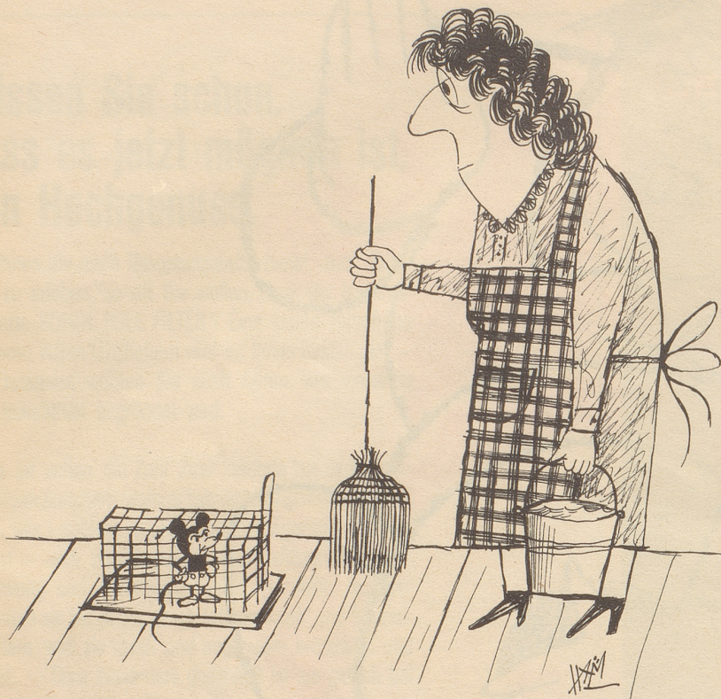
Es muß ein Irrtum sein!