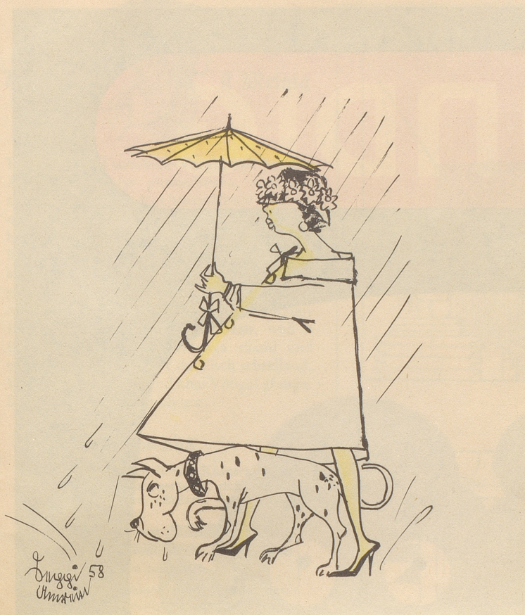
Jede Mode hat ihr Gutes!