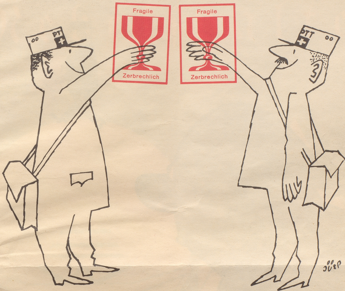
Pöstler als Pröstler