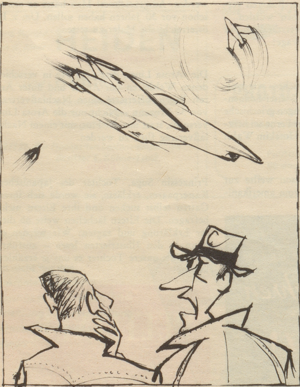
absoluter Irrsinn, wir gehen der Vernichtung entgegen . . .