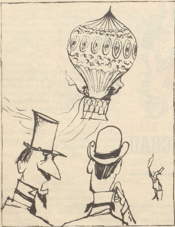
Reine Hexerei — das Ende der Menschheit . . .