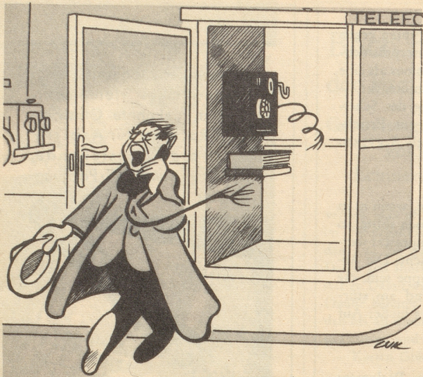
« Ja, ja, ich komme ja schon, bin schon unterwegs! » . .