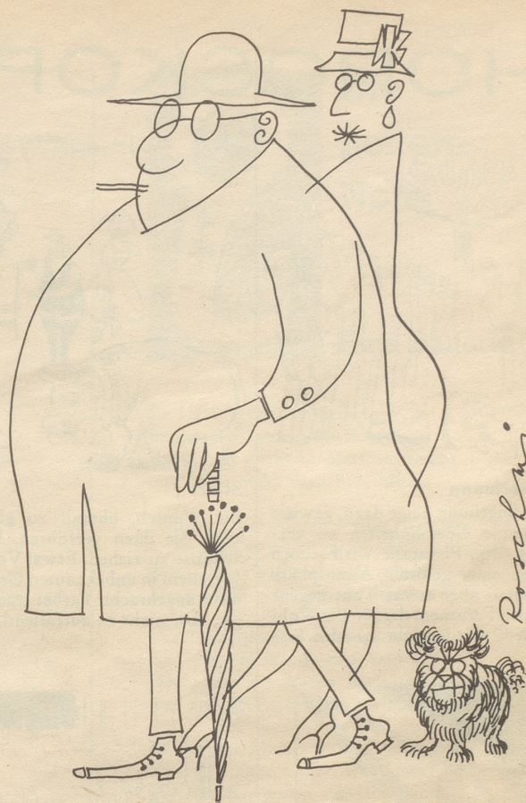
«Es Abzeiche? Nei üs git ou niemer öppis!»

Der kleine Markus geht mit seiner Großmutter spazieren und Großmutter erklärt ihm das und jenes. «Das ist ein Töff-töff-Auto!» sagt sie. – «Aber Grossi», empört sich der Knirps, «das ist doch ein Opel-Kapitän mit Kurzhub-Motor und Vollsicht-Panorama-Windschutzscheibe!» TR