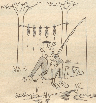
Ordnung muß sein!

Antwort: «Entweder hast Du nicht die richtigen Mädchen, oder nicht den richtigen Freund. Oder beides.»