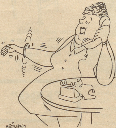
«-- öb ich au Hulahoop machi? Sowieso!»

Richtig, am Bahnhof steht in einer Ecke ein verlassener Puppenwagen. Aber von dem Kinde findet die besorgte Mutter keine Spur. Unterdessen ist zu Hause ein telefonischer Anruf erfolgt: Claudia kann am nächsten Bahnhof abgeholt werden. Die selbständige Kleine war in einen eingefahrenen Zug gestiegen, selig losgefahren, aber an der nächsten Haltestelle wieder hinausbefördert worden. Glücklicherweise konnte sie Namen und Adresse tadellos dahersagen.