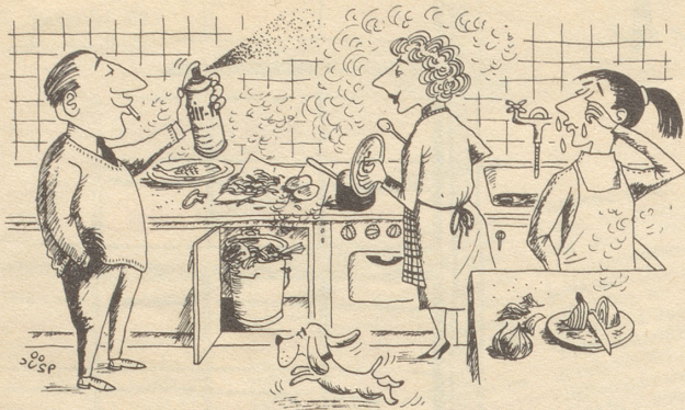
Familienfriede... trotz Küchengerüchen