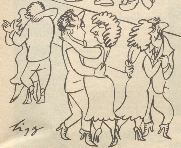
Ball auf dem Dorfe

«Bitte Maestro mol spiila una canzone napolitana!»