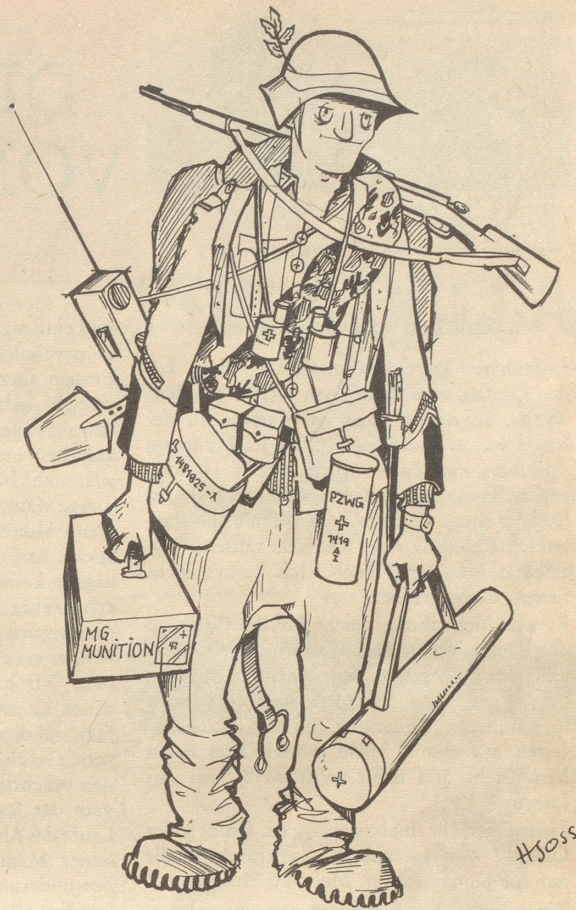
«Gopfriedschtutz mi Hoseträger ...»