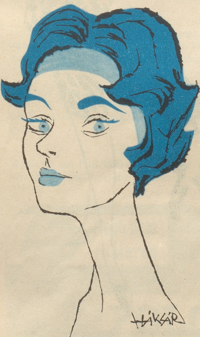
Farben-Tipp für den Winter

Zuschriften für die Frauenseite sind an folgende Adresse zu senden: Bethli, Redaktion der Frauenseite, Nebelspalter, Rorschach.