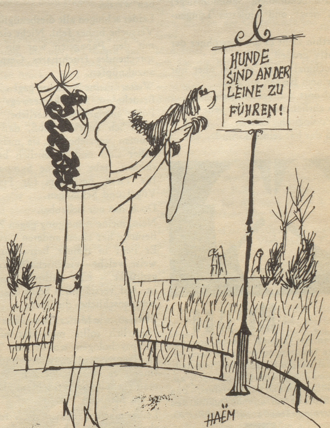
«Geesch Fifi i cha nüüt defür!»