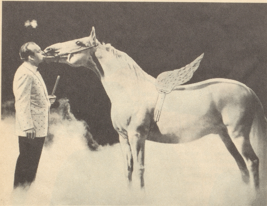
Freundschaft in der Manege: