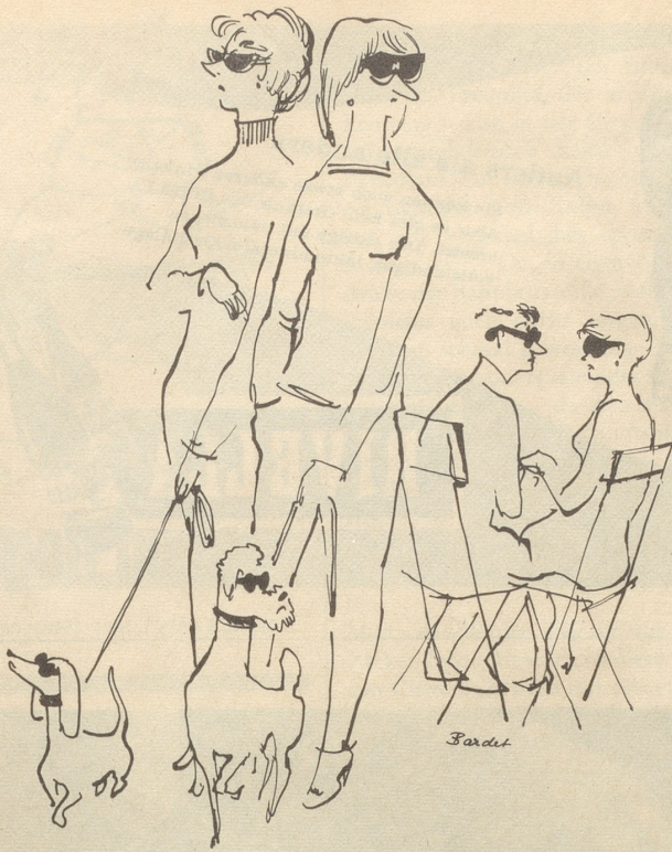
Hütet euch, die Sonne scheint!