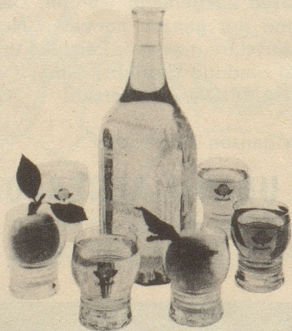
Schweiz. Obsterband Zug