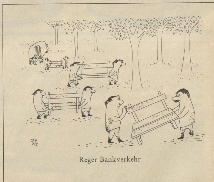
W.S. Reger Bankverkehr

Daraufhin wurde beschlossen, den bedauerlichen Zwischenfall nicht ins Protokoll aufzunehmen, den wohl vorbereiteten Protest gegen den Mißbrauch der Schweizer Folklore gutzuheißen und den Vorstand für eine weitere Amtsdauer von vier Jahren zu bestätigen.