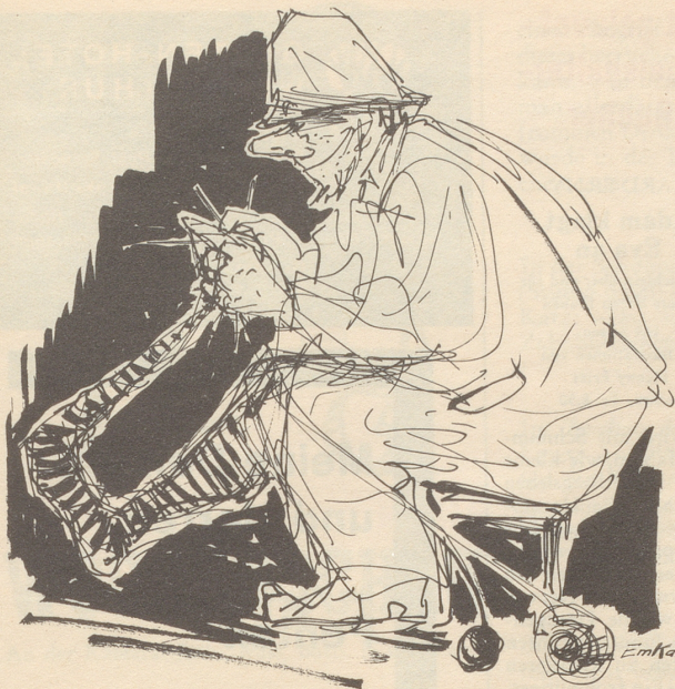
Selbst ist der Mann