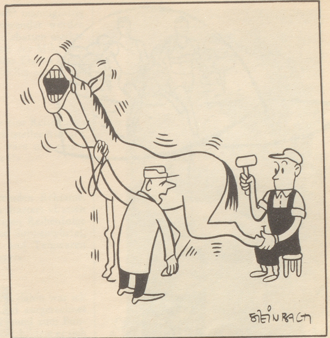
«Gänzi acht a de Fueßsole isch er chutzelig!»