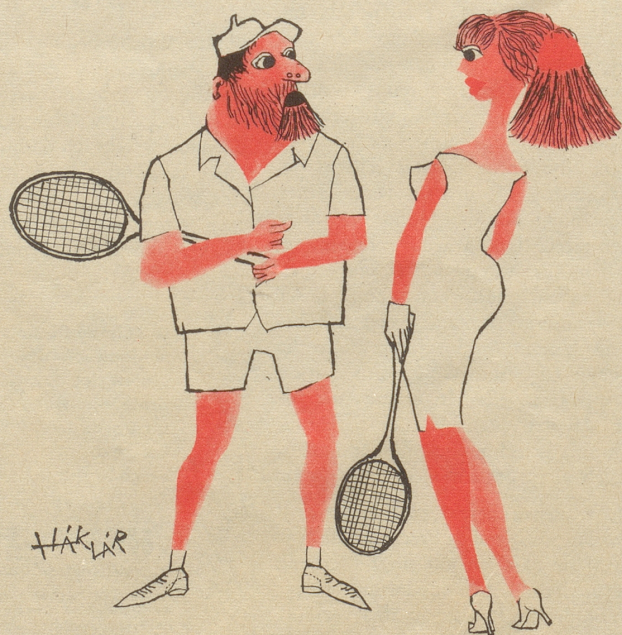
Der modische Akzent liegt immer noch oben!

Warum gibt es große und riesengroße und überreich tragende Tomaten, runde und längliche, rote und gelb-grüne, aber keine, die nicht fleckig werden? Ich wäre mit einem Drittel des Ertrages zufrieden, wenn er nur