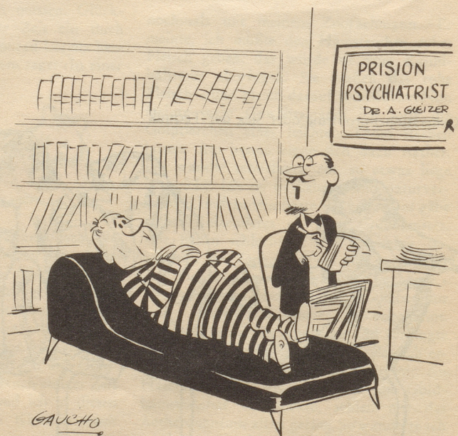
Milderungsgründe am laufenden Band

«Die Tatsache, daß Sie sich erwischen ließen, beweist, daß Sie nicht voll zurechnungsfähig sind.»