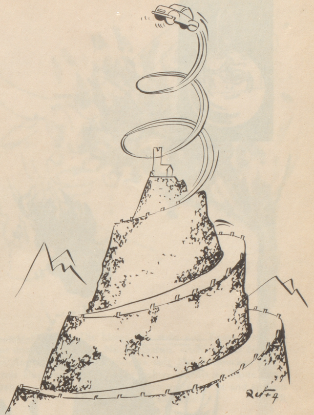
Verzell du das em Turmwächter!

Jetzt müßte man mir nur noch zeigen, wie ein moderner und sympathischer Schauspieler aussieht.