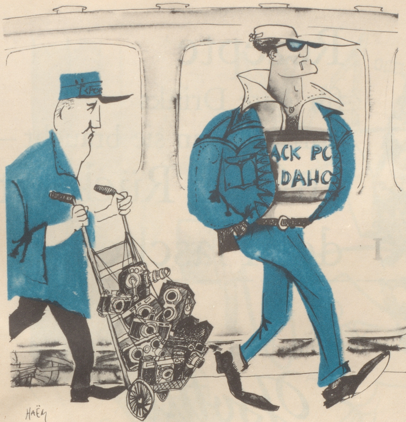
Amerika auf Reisen