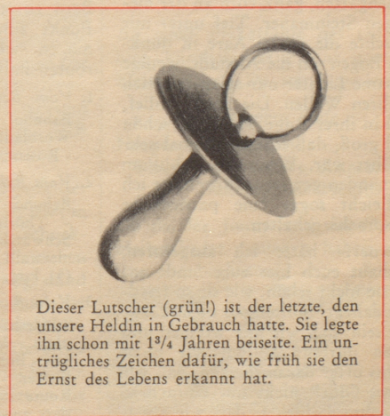
Dieser Lutscher (grün!) ist der letzte, den unsere Heldin in Gebrauch hatte. Sie legte ihn schon mit 13/4 Jahren beiseite. Ein untrügliches Zeichen dafür, wie früh sie den Ernst des Lebens erkannt hat.

stimmte, niemals knapp zu bemessende Länge aufweisen. Man rechnet auch hier üblicherweise 100 Memoiren pro Hektare.