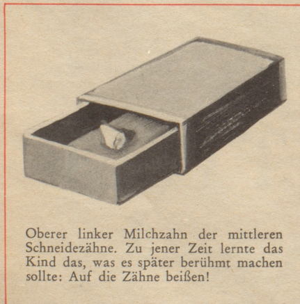
Oberer linker Milchzahn der mittleren Schneidezähne. Zu jener Zeit lernte das Kind das, was es später berühmt machen sollte: Auf die Zähne beißen!