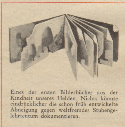
Eines der ersten Bilderbücher aus der Kindheit unseres Helden. Nichts könnte eindrücklicher die schon früh entwickelte Abneigung gegen weltfremdes Stubengelehrtentum dokumentieren.