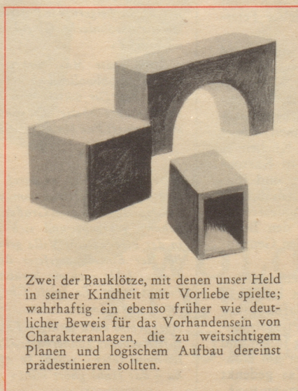
Zwei der Bauklötze, mit denen unser Held in seiner Kindheit mit Vorliebe spielte; wahrhaftig ein ebenso früher wie deutlicher Beweis für das Vorhandensein von Charakteranlagen, die zu weitsichtigem Planen und logischem Aufbau dereinst prädestinieren sollten.

ist die zweite Variation, bei der das «zwar» von einiger Bedeutung bleibt. Diese Lösung ist in ihrer Wirkung vielleicht sogar noch stärker als die vorangehende, weil hier eine Liste der trotz Mittelmäßigkeit genial Gewordenen nicht anzubringen sich schickt, so daß der Memoirierte sich deutlich als Ausnahmefall darstellt.