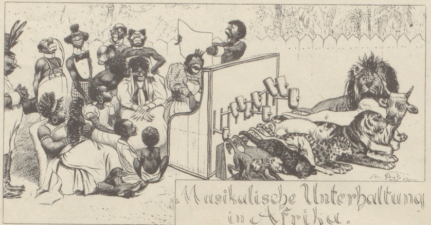
Musikalische Unterhaltung in Afrika.