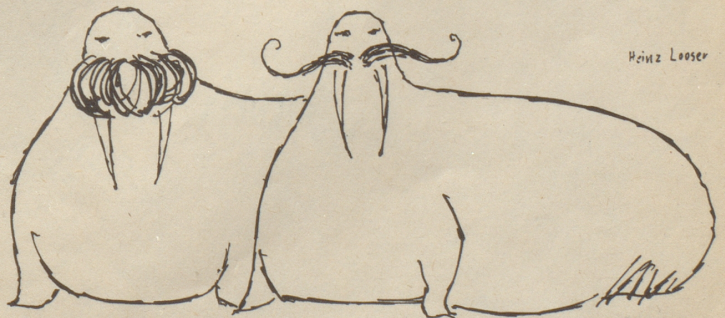
Seeleu hält etwas auf sich