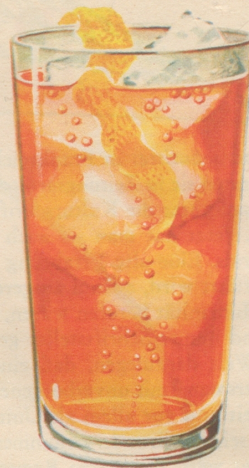
On the Rocks Ein mit Eiswürfeln bis an den Rand gefülltes Normal-Whiskyglas mit 40-50 gr. Four Roses Bourbon Whisky übergießen. Je nach Wunsch mit Sodawasser auffüllen u. dann eine Zitronenspirale dazugeben.