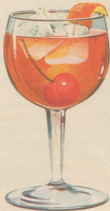
Manhattan 2-3 Tropfen Angostura-Bitter, 1 Teil italienischen Vermouth und 2 Teile Four Roses mit Eis im Shaker mischen, auf eine Kirsche in ein Cocktailglas abfüllen. Orangenschale, wenn gewünscht, hinzufügen.