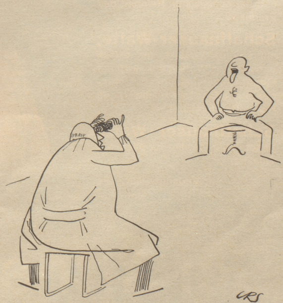
Der vorsichtige Arzt «Ich vermute Grippe.»