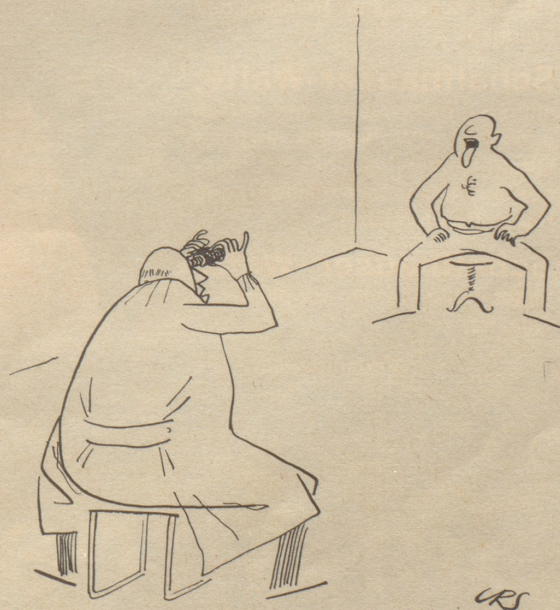
Der vorsichtige Arzt «Ich vermute Grippe.»