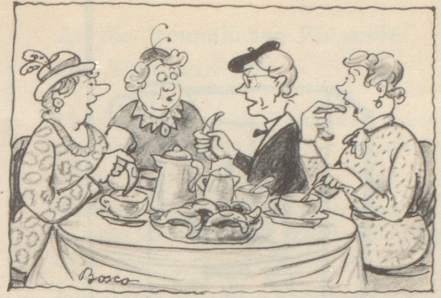
Au e Gipfelkomferenz wo nöd vill drbii uselueget