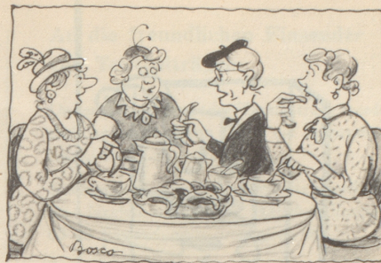
Au e Gipfelkomferenz wo nöd vill drbii uselueget