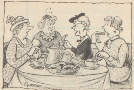
Au e Gipfelkomferenz wo nöd vill drbii uselueget