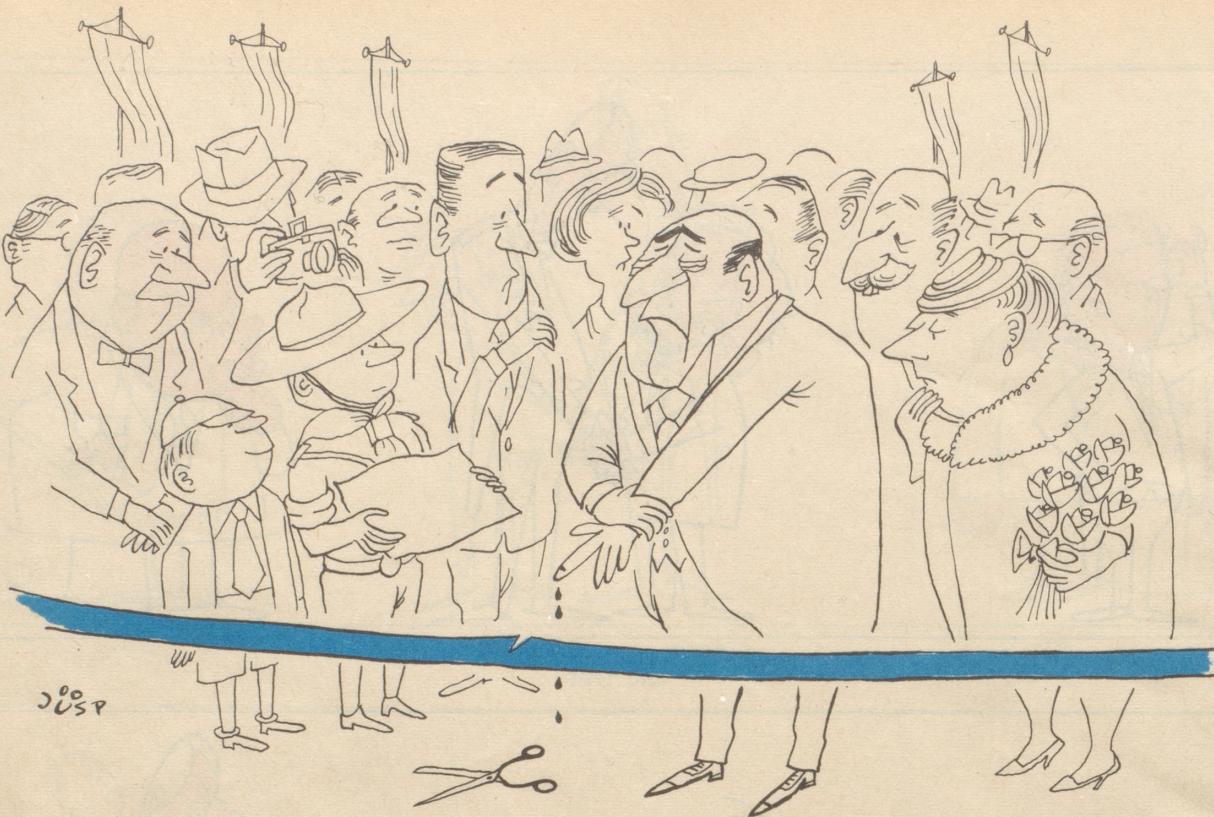
Die aberheite Einweihung